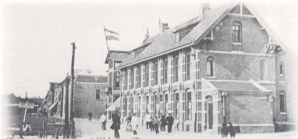
Postkantoor, op de hoek van de Haltestraat/Tramstraat

Onze bemiddeling kwam voor deze panden te laat, maar voor Uw pand bemiddelen wij gaarne nu of in de toekomst