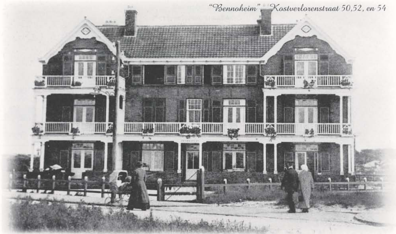
"Bennoheim" Kostverlorenstraat 50, 52, en 54